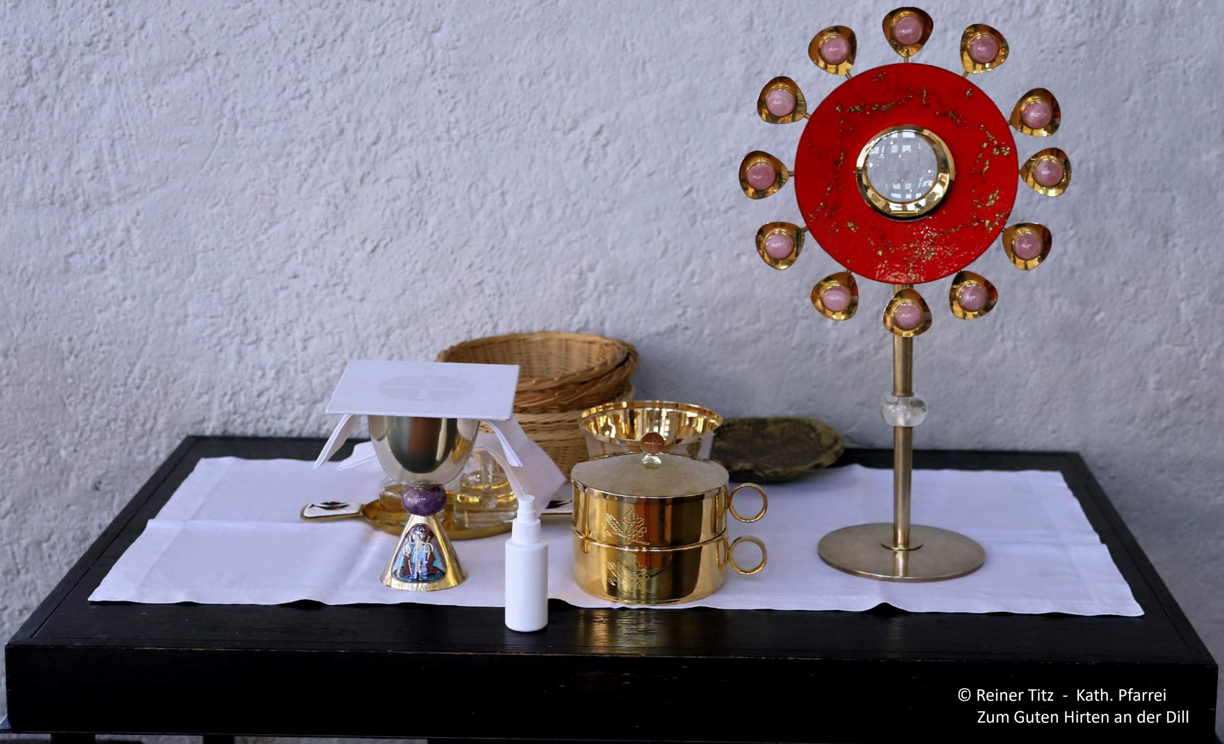
© Reiner Titz - Kath. Pfarrei Zum Guten Hirten an der Dill